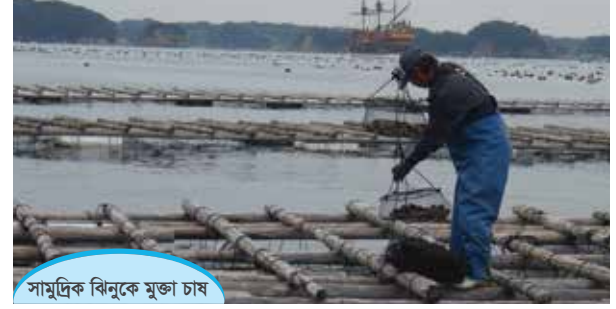
সামুদ্রিক বিনুকে মুক্তা চাষ

চাষের জন্য অত্যন্ত উপযোগী। শামুক/ বিনুক অতি অল্প ব্যয়ে অধিক মুনাফা অর্জন করা সম্ভব বলে উপকূলীয় এলাকার দরিদ্র নারী পুরুষদের এ কাজে নিয়োজিত করা যেতে পারে। তাছাড়া সামুদ্রিক বিশেষ প্রজাতি