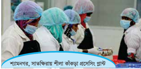
শ্যামনগর, সাতক্ষিরায় শীলা কাঁকড়া প্রসেসিং প্লান্ট

ভাবে চাষ করা যায়, লোনা পানিতে অন্যান্য মাছের সাথে মিশ্র এবং খাঁচায় অধিক ঘনত্বে একক চাষ করা যায় পাশাপাশি নরম খোলস যুক্ত কাঁকড়ার নির্বাচিত চাষ উল্লেখযোগ্য পদ্ধতি। বাংলাদেশে কক্সবাজার এবং সাতক্ষীরা এলাকায় সীমিত আকারে শীলা কাঁকড়ার চাষ বেসরকারি উদ্যোক্তা পর্যায়ে শুরু হয়েছে। এই চাষ পদ্ধতি চীন, ফিলিপাইন, মায়ানমার, মালয়েশিয়া, ভিয়েতনাম ও থাইল্যান্ড এ সকল দেশে বেশ জনপ্রিয়তা লাভ করেছে। এ সকল দেশে কৃত্রিম পদ্ধতিতে শীলা কাঁকড়ার পোনা উৎপাদন করা হয়। বাংলাদেশে এখনো পর্যন্ত কৃত্রিম প্রজননের মাধ্যমে শীলা কাঁকড়ার পোনা উৎপাদন করা সম্ভব হয়নি। নরম খোলস যুক্ত কাঁকড়া যেহেতু দক্ষিণ এশীয় এলাকায় উল্লেখযোগ্য রেস্টুরেন্ট খাবার হিসেবে জনপ্রিয়তা লাভ করেছে সেক্ষেত্রে কাঁকড়ার চাষ শ্যামন-গর সহ উপকূলীয় এলাকা, মহেশখালী, কক্সবাজার উপকূলীয় অঞ্চলে সম্প্রসারণ করা যেতে পারে। পাশাপাশি হ্যাচারী স্থাপনের উদ্যোগ জরুরী। প্রাকৃতিক উৎস থেকে কাঁকড়ার পোনা আহরণ যা পরিবেশ ও জীববৈচিত্রের জন্য হুমকি স্বরূপ।